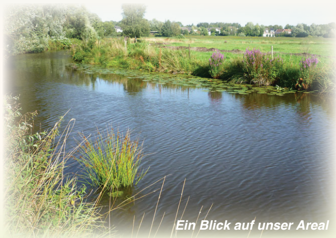
Ein Blick auf unser Areal

Die Ortsgruppe Ritterhude wurde 1978 gegründet und hat ca. 200 Mitglieder. Ziel ist es, den Wert der Natur in der Gemeinde Ritterhude zu erhalten und zu erweitern. Man kann direkt vor die Tür gehen und etwas für die Natur tun: Wir haben eine wunderbare „Hammewiesen-Landschaft“, die erhalten werden soll!